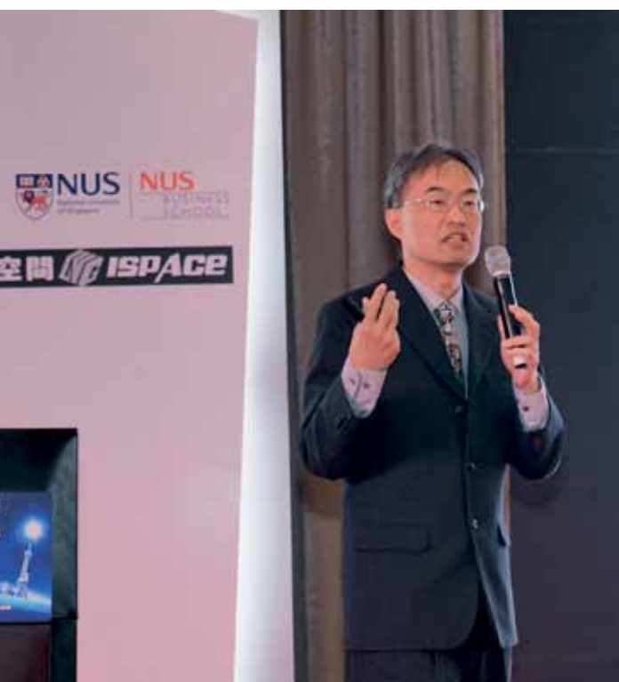
◀ 新加坡国立大学商学院策略与政策系钟基年教授发表题为《如何管理企业集团以促进创新？》演讲

知名高校“连接创业者行动”启动仪式意在构建起更大、更有活力的创业生态圈，更好的激发创新能量。希望成为自由、宽容创新环境的营造者；便利、高效创新服务的供给者；开放、合作创新资源的整合者以及专业、跨界创新价值的驱动者。一起营造属于上海，符合张江科创精神的创业文化，让现在以及未来的创业者们能够在更好的环境中萌生创意、迸发能量，为我们创造出更丰富多彩的新产品和新体验。