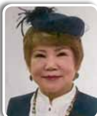
王玥郡校友 (第3届人力资源课程)