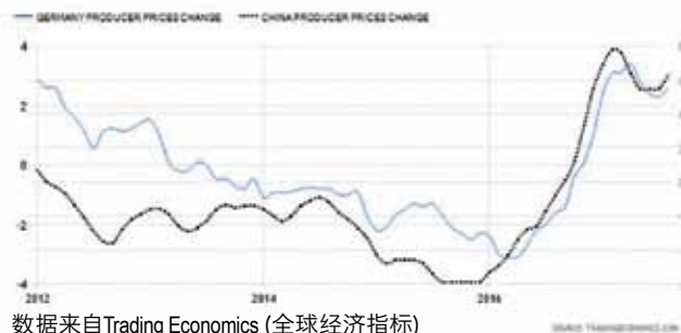
数据来自Trading Economics (全球经济指标)

大的提振。这就是需求侧的影响，大家还愿不愿意去花更高的价钱去买东西，这是一个未知数。