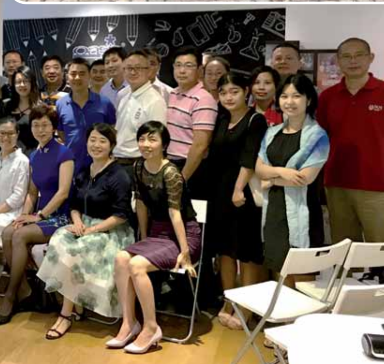
(新加坡国立大学商学院上海办公室 供稿)