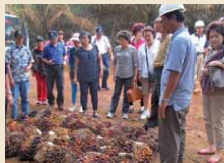
农园负责人解释棕榈树浑身是宝