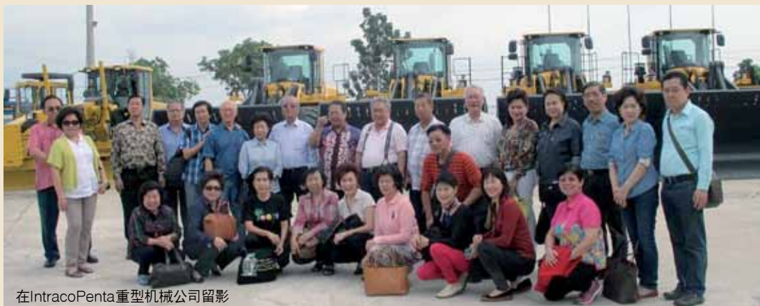
在IntracoPenta重型机械公司留影