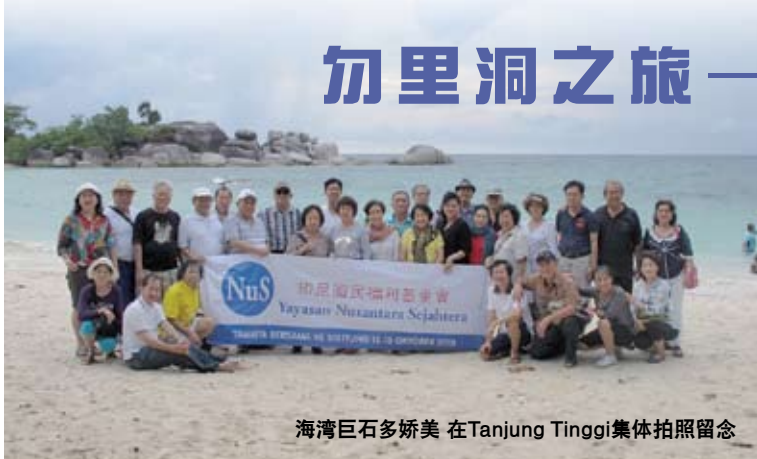
海湾巨石多娇美 在Tanjung Tinggi集体拍照留念